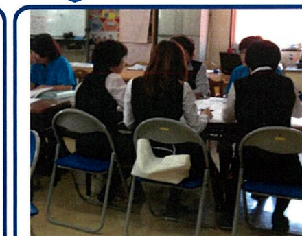
店員さんの教育に